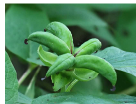
ヤマシャクヤク (記録作成：事務局)