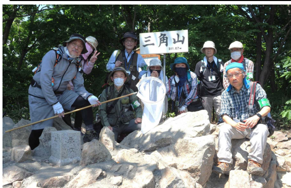
「三角山」山頂にて参加者記念写真