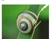
サッポロマイマイ