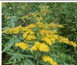
オオアワダチソウ