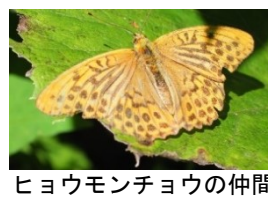
ヒョウモンチョウの仲間