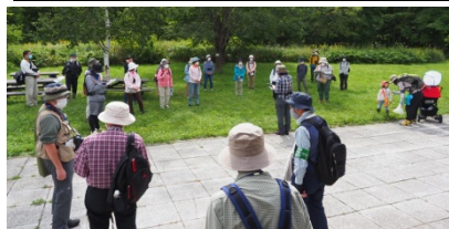
開会式：自然ふれあい交流館前庭