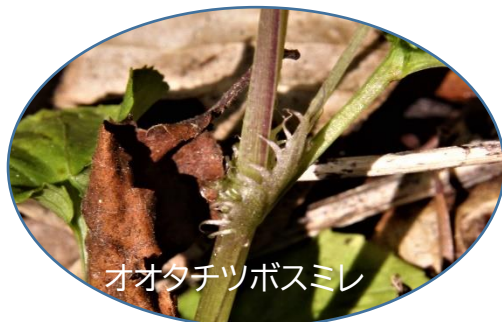
オオタチツボスマレ