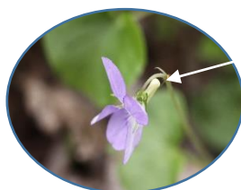
オオタチツボスマレの距