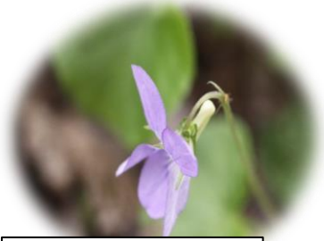
オオタチツボスマレ