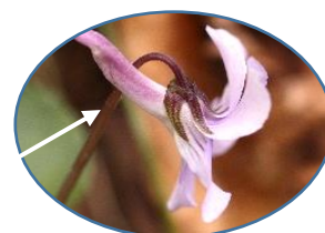
ナガハシスマレ(テングスマレ)の距は大きいぞ

この写真は、恵庭公園で撮りました。オオタチツボスマレの花を撮ってきたのですが、拡大してビックリ。側弁の基部に毛があるではありませんか。アイヌタチツボスマレでした。